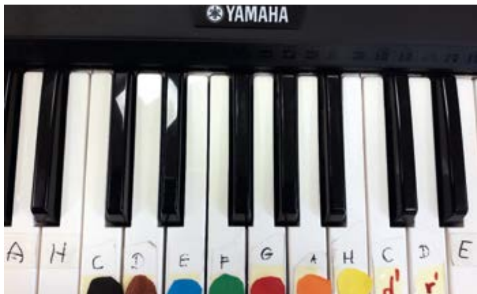
2. ábra: Tanuló-szintetizátor színes billentyűkkel

Az Ulwila német módszert Vető Anna gyógypedagógus adaptálta magyarra 1991-ben. Rengeteg kottát, sőt partitú-